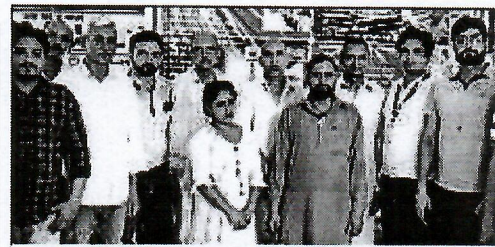
स्वास्थ्य जांच शिविर में बाबा मस्तनाथ विश्वविद्यालय एवं हॉस्पिटल की टीम के साथ ग्रामीण।