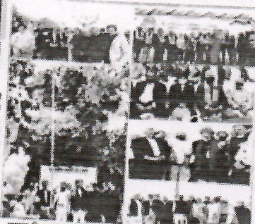
राष्ट्रीय कुलाधिपति प्रतिनिधि डॉ. अंजना राव के अध्यक्षता में आयोजित बैठक में भाग ले रहे कुलाधिपति डॉ. अंजना राव।

विश्वविद्यालय के कुलाधिपति डॉ. अंजना राव ने अपने संबोधन में कहा कि देश की एकता और अखंडता ही असली आजादी है। उन्होंने कहा कि देश की एकता और अखंडता बनाए रखना ही असली आजादी है। उन्होंने कहा कि देश की एकता और अखंडता बनाए रखना ही असली आजादी है।