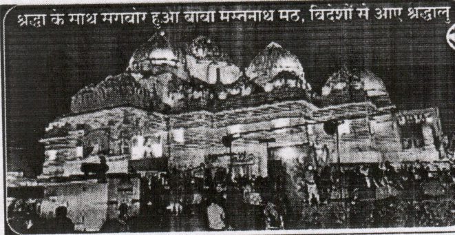
श्रद्धा के माथ सराबोर हुआ बाबा मस्तनाथ मठ, विदेशों से आए श्रद्धालु