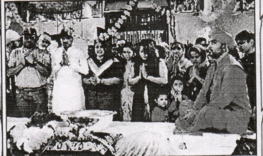
रोहतक। मठ में दर्शन करते श्रद्धालु।